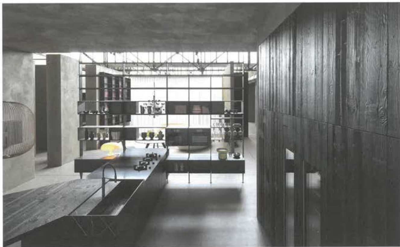
Cucina Cesar all'interno dello showroom aziendale di Pramaggiore (VE)

mercato, il 2020 di Cesar è stato a dir poco esplosivo. Nonostante la pandemia, l'azienda ha continuato a crescere e punta a chiudere l'anno con 32 milioni di ricavi contro i 28 milioni del 2019, a sua volta in crescita (+13%) rispetto all'esercizio precedente. Oltre all'Italia, i mercati chiave dell'azienda sono Russia, Francia, Stati Uniti ed Europa in generale. Piani futuri? "Vogliamo analizzare a fondo quanto già fatto dal 2015 a oggi – afferma Cester – cercando di intervenire per migliorare quel che è migliorabile. Per questo abbiamo rafforzato il team manageriale, con l'ingresso in azienda e nel capitale di un manager di grande esperienza nel settore, il cui compito è quello di colmare un vuoto legato all'engineering. È lui 'l'uomo del motore' di Cesar, colui che renderà coerente il processo organizzativo e funzionale della nostra azienda. E continueremo ad investire in tecnologia, per diventare ancora più forti e poter progredire".